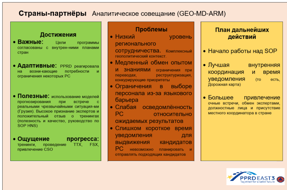
Иллюстрация 5: Аналитическое совещание PC