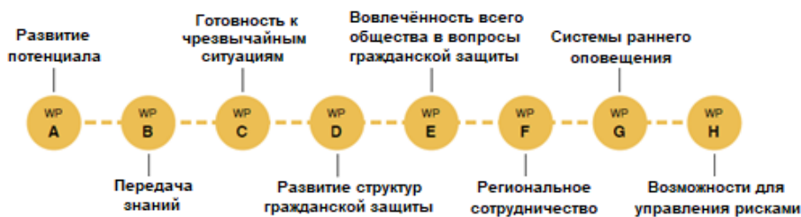
Иллюстрация 2: Комплекс работ в рамках PPRD East 3

Программа разработана с целью максимизации воздействия на каждую страну-партнёра (PC). В процессе разработки программы учитывались национальные потребности и возможности, благодаря чему она способствует взаимному обучению, обмену опытом и передовыми практиками между странами-партнёрами (PC), а также с государствами-членами ЕС и со странами-членами и участниками Механизма гражданской защиты (UCPM). Тематический фокус программы это – восемь тесно переплетённых и взаимосвязанных комплексов работ (WP), которые осуществляются под предводительством эксперта из консорциума.