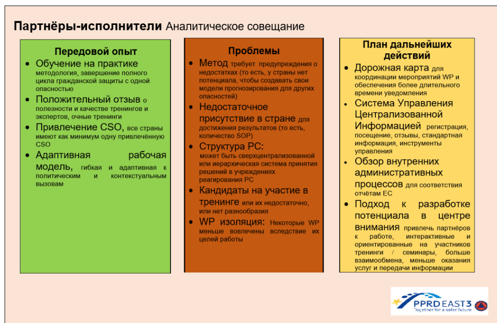
Иллюстрация 6: Аналитическое совещание партнёров-исполнителей

В заключение необходимо отметить, что внутренняя отчётность и административные процессы были выделены некоторыми экспертами в качестве вопроса для рассмотрения руководством.