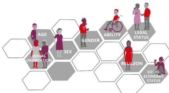
Иллюстрация 3: Иллюстрация межсекторальных факторов

Работа будет проводиться в соответствии с международной нормативной базой (Сендайская Программа по снижению риска стихийных бедствий, Цели в области устойчивого развития, Парижское соглашение, «Зеленая сделка» ЕС и Стратегия гендерного равенства ЕС), так же, как и в соответствии с национальным законодательством, нормами и приоритетами оперативной деятельности.