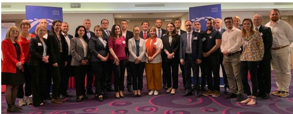
Иллюстрация 4: Встреча команды PPRD East 3 на Европейском Форуме Гражданской Защиты.

Программа PPRD East 3 была широко представлена во время 7-го Европейского Форума Гражданской Защиты, проходившего в Брюсселе 28-29 Июня 2022-го года. От программы PPRD East 3 в Форуме участвовали главы национальных программ и национальные координаторы всех стран-партнёров (РС). Кроме того, по два представителя агентств по гражданской защите были приглашены со стороны DG ECHO.